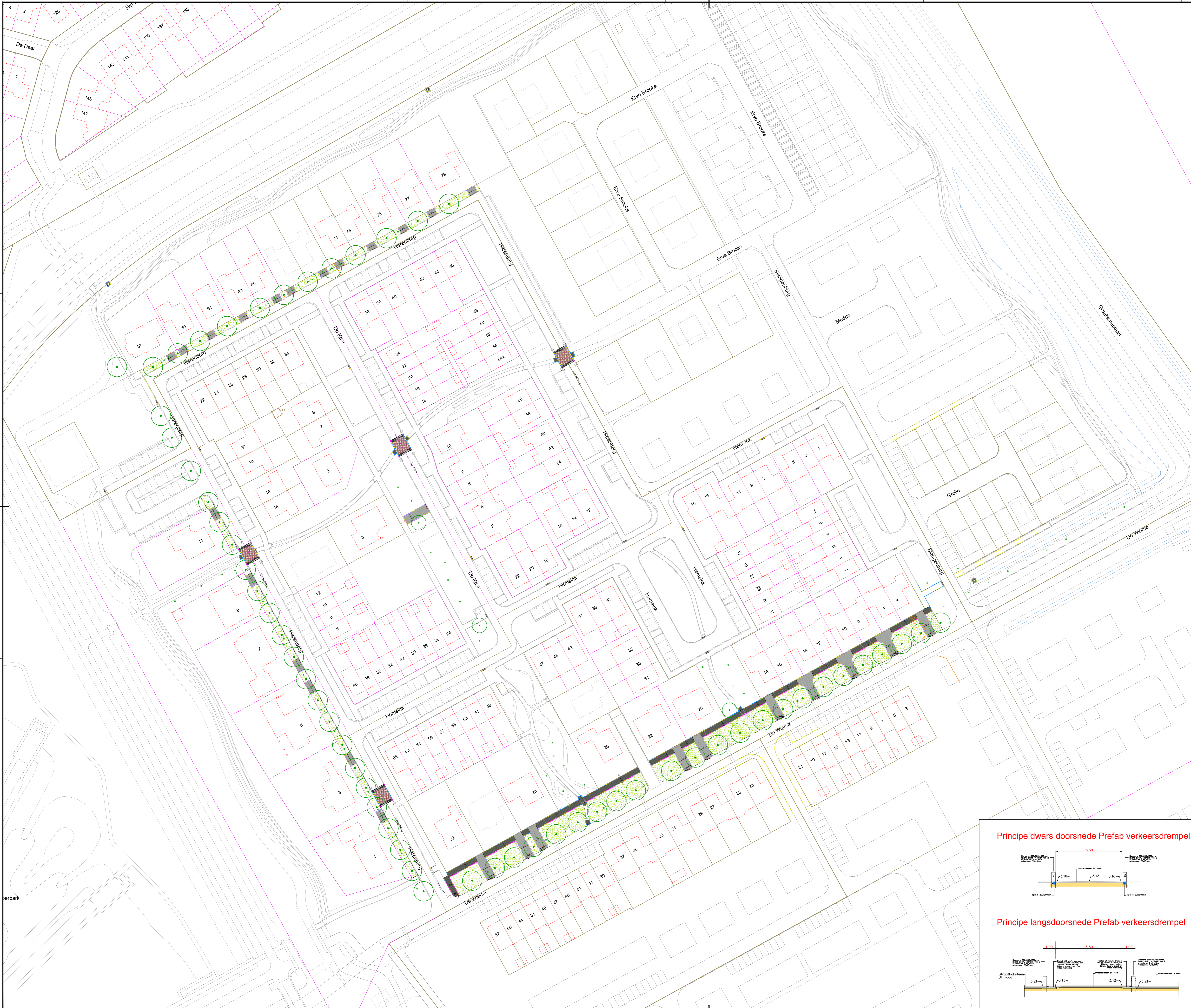
Principe dwars doorsnede Prefab verkeersdrempel